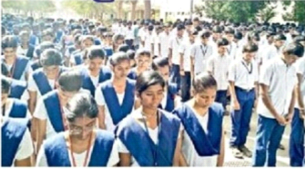
బ్రిపుల్ ఐటీలో హాజరైన విద్యార్థులు