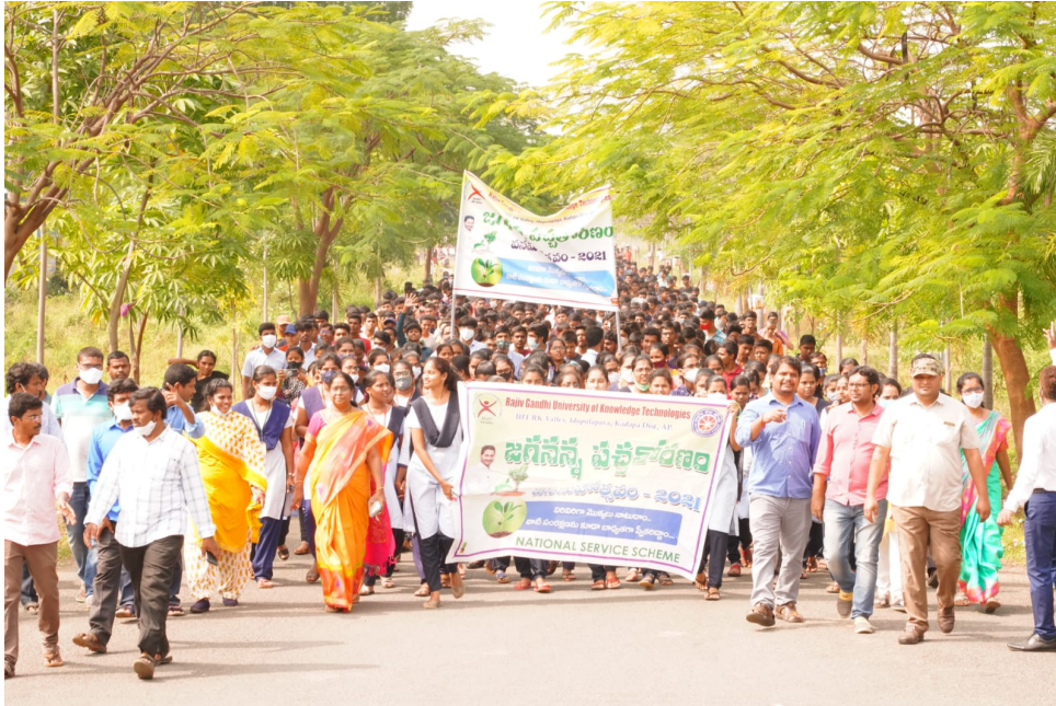
Mega Rally and campaign program on importance of tree plantation

Administrative Officer, Academi Dean, Finance Officer, Academic Dean and other administrative officers along with all programme officers participated in program and motivated students.