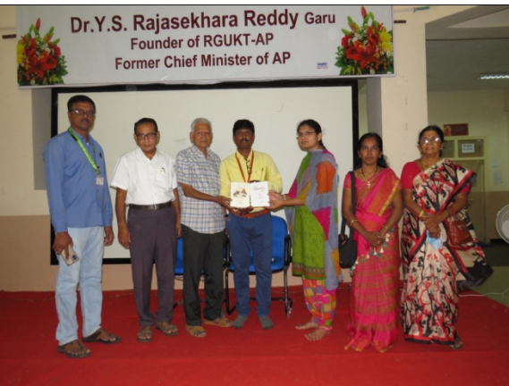
Dr.Y.S. Rajasekhara Reddy Garu Founder of RGUKT-AP Former Chief Minister of AP