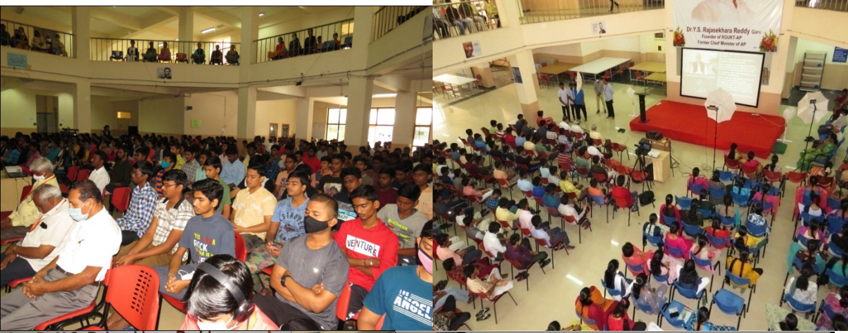
Dr.Y.S. Rajasekhara Reddy Garu Founder of RGUKT-AP Former Chief Minister of AP